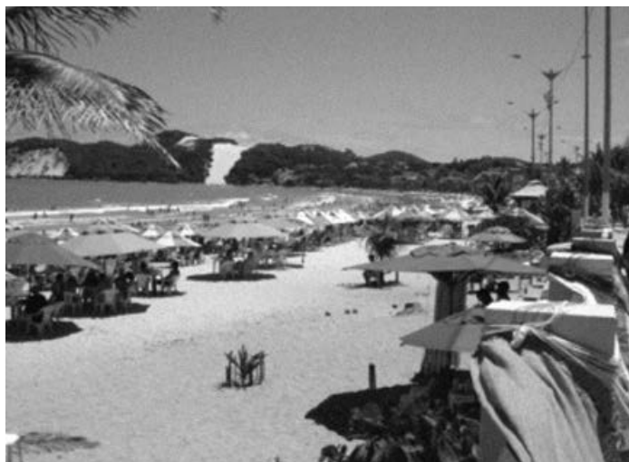
Figura 1 – A praia de Ponta Negra, contexto de transnacionalização da intimidade e espaço social gerador de cadeias de mobilidades turísticas e migratórias.

A evolução da intimidade no sentido da conjugalidade concretiza-se de forma gradual, através de arranjos variáveis e moldáveis que nem sempre passam, pelo menos no imediato, pela institucionalização matrimonial, reflectindo tendências de diversidade já bastante expressivas nos padrões contemporâneos de organização da vida de casal. Todavia, num ou noutro momento, muitos desses arranjos acabam por ser juridicamente formalizados como casamentos, tanto mais não seja por razões pragmáticas de agilização da gestão dos fluxos, residência e cidadania dos cônjuges e dos seus descendentes.