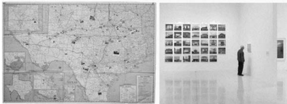
Figura 2 – Mapa de percurso que é exposto com as fotografias dos cinemas de Alec Soth.