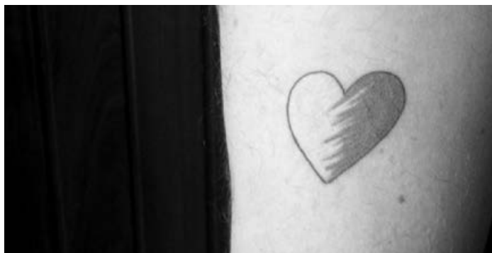
Figura 2 – Imigrante europeu em Ponta Negra. Exibe no braço um coração com as cores do Brasil, sinal dos fortes vínculos de intimidade que o ligam ao contexto de acolhimento e que, a montante, contribuíram decisivamente para a sua mobilidade migratória.

A admissão da importância de aspectos da esfera da intimidade e da família na afluência de europeus a Ponta Negra não implica, à semelhança do que referi para as brasileiras que fazem o percurso inverso, a recusa analítica de muitas outras razões que coexistem de forma dinâmica e, em certa medida, deixam perceber o quão redutor é o próprio conceito de “marriage migrations” se circunscrito apenas a aspectos estritamente conjugais. De entre essas outras razões destacam-se, desde logo, as económicas e as razões que remetem para os ordenamentos e quotidianos dos contextos de proveniência dos imigrantes. De um modo geral, as suas mobilidades migratórias são, ao mesmo tempo, matrimoniais, patrimoniais e de estilo de vida – “lifestyle migration”[17] –, contemplando, além dos motivos passionais, um vasto conjunto de expectativas relacionadas com o trabalho, o lazer e a organização e ritmo da vida diária. São expectativas que os próprios, por comparação com os seus países de origem, julgam mais facilmente compatíveis e concretizáveis no Brasil. Contudo, e apesar da experiência prévia acumulada como turistas, as suas ideias e idealizações iniciais confrontam-se, amiúde, com imponderáveis e desencantos que os levam a reformular a visão turística idílica original e, não raro, a reconsiderar o próprio projecto migratório e conjugal.