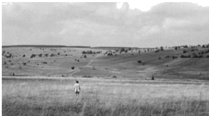
Figura 1 – Plano do filme de Wim Wenders, Kings of the Road (1976).

4. Recepção do mapa: Os dois personagens deste filme são, desde início, espectadores um do outro e de si próprios, agem e reagem um ao outro, bem como ao percurso. Parece-nos que eles constituem os primeiros espectadores deste percurso no mapa, bem como no filme, espelhando o papel do espectador de cinema dentro do próprio filme. A nossa recepção do filme é auxiliada pela ideia de mapa percorrido, entrando a figura do mapa no filme, a dada altura, como fundo da cena, por detrás de um dos personagens, remetendo também para a ideia de percurso interior.